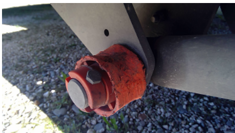
Observation 0302 : Usure des flasques de galets