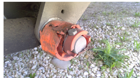
Observation 0302 : Usure des flasques de galets