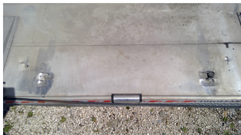
Observation 0302 : Déformation du plateau PERFORATION DU DESSOUS DU PLATEAU (DOUBLE FOND)