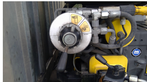
Observation 0203 : Disfonctionnement du stabilisateur STABILISATEUR COTE DROIT NE FONCTIONNE PAS NI LA COMMANDE D EXTENSION DE POUTRE, NI LA