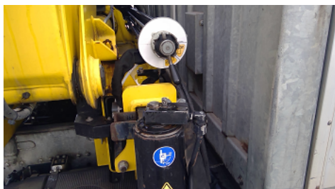
Observation 0903 : MANQUE LEVIER DE VANNE POUR STABILISATEUR COTE GAUCHE