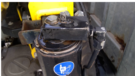
Observation 0903 : MANQUE LEVIER DE VANNE POUR STABILISATEUR COTE GAUCHE