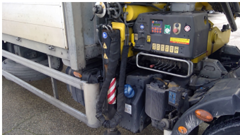
Observation 0203 : Disfonctionnement du stabilisateur STABILISATEUR COTE DROIT NE FONCTIONNE PAS NI LA COMMANDE D EXTENSION DE POUTRE, NI LA