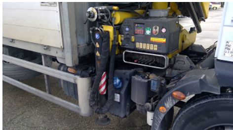
Observation 1201 : Essais en charge non réalisés, motif : PROBLEME SUR LA STABILISATION STABILISATEUR COTE DROIT NE FONCTIONNE PAS