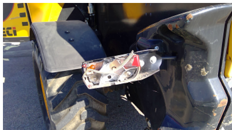
Observation 0501 : Détérioration du(des) feu(x)