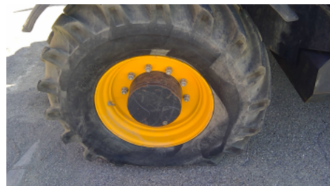
Observation 0202 : Défaut de pression du(des) pneu(s) avant gauche