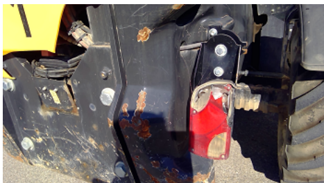
Observation 0501 : Détérioration du(des) feu(x)