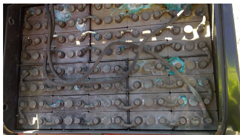
Observation 1101 : PAS D'INFOS POIDS MINI MAXI DE LA BATTERIE SUR PLAQUE CONSTRUCTEUR PAS D'INFOS POIDS