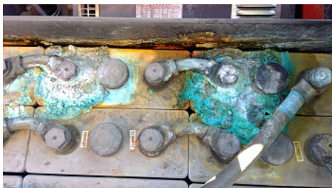
Observation 0402 : Défaut d'aspect de la batterie