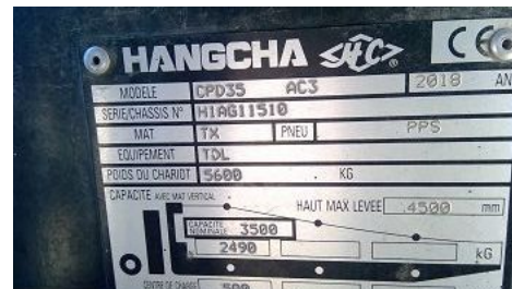
Observation 1101 : PAS D'INFOS POIDS MINI MAXI DE LA BATTERIE SUR PLAQUE CONSTRUCTEUR PAS D'INFOS POIDS