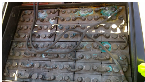
Observation 0402 : Défaut d'aspect de la batterie